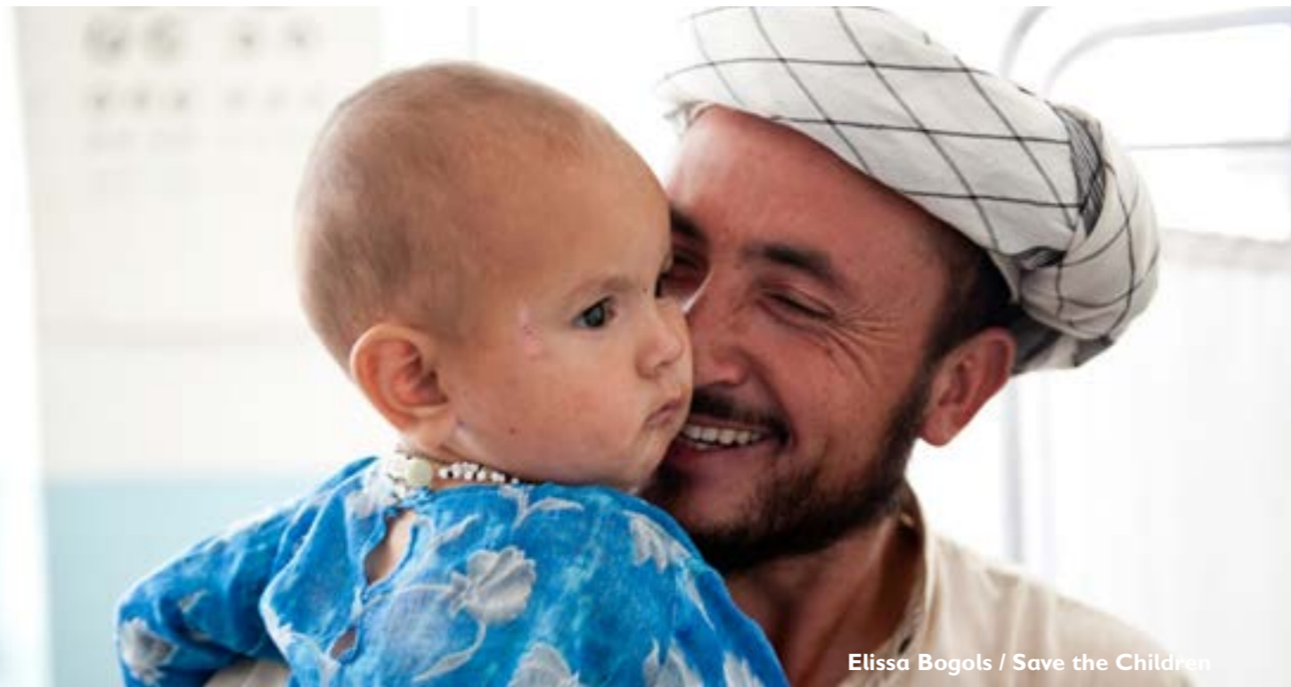
Elissa Bogols / Save the Children